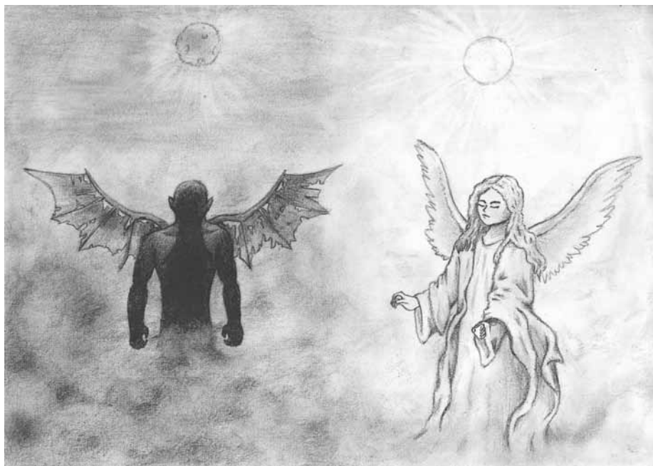
Danijel Jerčinović, 2. PG